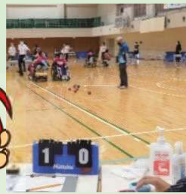
三重大会マスコット とこまる