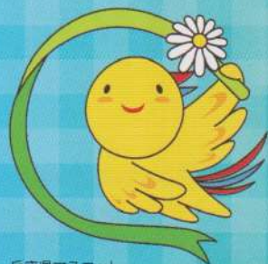
兵庫県マスコット はばタン